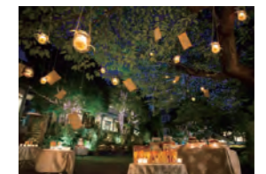
神戸北野サッセン邸