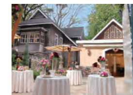
フェリーチェガーデン日比谷