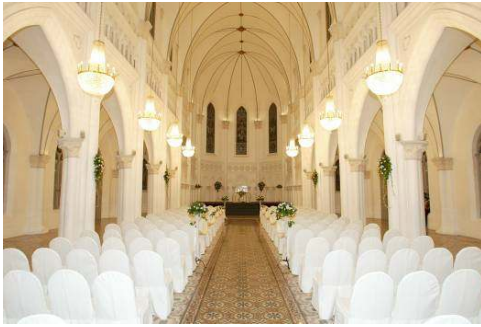
「チャイムス・ホール」1階チャペル・バンケット