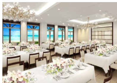
1階 収容人数 60名

チャペルから独立したプライベートコテージを新設。親族控室に加え、ゲスト待合室も備えており、他のカップルゲストに会うことなくお待ちいただけます。ドリンクカウンターではウェルカムドリンクでゲストをおもてなし。