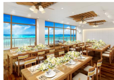
2階 収容人数 30名