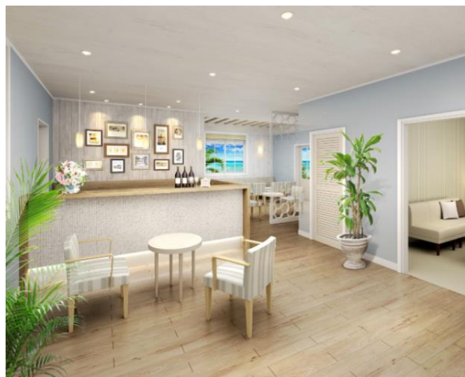
<フォトスポット&グリーティングコテージ（完成予想イメージ）>