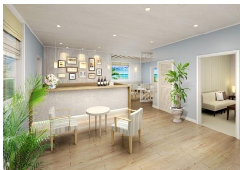
<グリーティングコテージ>

プライベートガーデンの開放的なロケーションを活かした、緑あふれるフォトスポットを新設。リゾートならではの雰囲気の中で、挙式の感動をそのままに、ゲストと一緒に撮影をお楽しみいただけます。