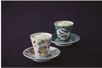
アミューズブーシュ 「カリフラワー和風ムース サマースノー」

※上記販売価格は2016年1月1日～2016年12月31日の挙式となります。乾杯用ドリンク、フリードリンクも含まれます。