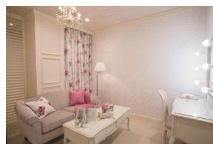
〈ブライズルーム「フローラル」〉