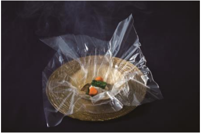
季節の沖縄海の幸 カルタ・ファタ包み

沖縄の名物「アグー豚」を直火で焦がし、だしの甘みと素材の苦味と風味、全てのバランスが絶妙にとれた一品です。