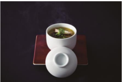
琉球フランク フォアグラと香り焼き鰯と共に

読谷の名物でもあるかつおを、オリジナルのソースで頂きます。魚本来の風味と「時を永遠に！」と、竜宮城のイメージで目出度い桜のスモークを纏わせました。演出と味、両方楽しめる一品です。