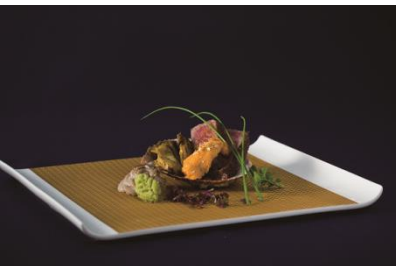
本部分とあわびの共焼き エシャロット醬油ソース 生雲丹わさびを添えて

アクアグレイス・チャペルの目の前に広がる魅力的な「海」をギュッと詰め込みました。包みをといた瞬間から広がる香りと共に、何処となく懐かしい味が沖縄の海を感じさせる一品です。