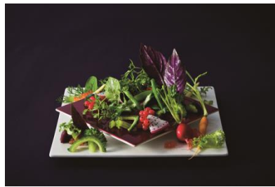
彩前菜「沖縄の風」(ガルグイユサラダ) 季節の沖縄野菜を中心にそれぞれの野菜に適した調理法を用いたサラダ仕立ての前菜。季節毎に内容を変え、同じ味は2度無いものを目指しています。アクアグレイス・チャペルならではのオリジナルガルグイユサラダをお楽しみください

和食で大切な甘味を調理段階ではなく仕上げに加えています。かつお節の風味とホワイトチョコレートが味に奥行きを与え、口の中に優しい余韻を。真っ白なムースにおめでたい絵柄の器が彩を添え、新和食の宴がはじまります。