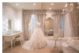
〈ブライズルーム「グレイス」〉