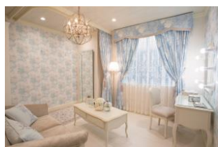
〈ブライズルーム「オペレッタ」〉

2つのバンケットがリニューアル。1階のバンケット「THE GARDEN(ザ・ガーデン)」は、目の前のガーデンを活かした開放感溢れる空間。天井にはシャンデリアが飾られ、琉球石灰石のウォールとダークウッドのインテリアが、モダンでエレガンスな雰囲気を醸し出します。2階のバンケット「THE TERRACE(ザ・テラス)」は海を見渡せるテラスが併設された、リゾートカジュアルテイスト。木のぬくもりを大切に、木目の表情を活かした落ち着いた雰囲気の中、ゲストとアットホームな時間をお過ごしいただけます。