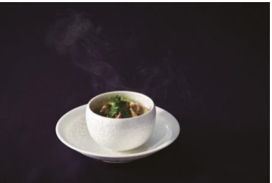
沖縄アグー豚と茄子 根野菜の甘み碗

濃厚なフォアグラのソテーに、同じく濃厚な鰯。口あたりを極限まで重要視した、やさしい和風のフランクとの組み合わせは、新和食ならではの「琉球フランク」です。