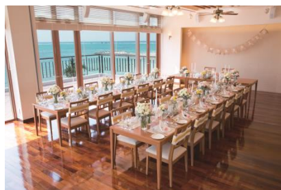
〈2階「THE TERRACE」 収容人数: 38名(着席)〉