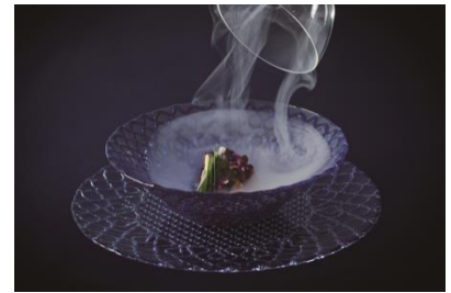
読谷の海 竜宮カルパッチョ ～HAL YAMASHITA スタイル～

読谷の名物でもあるかつおを、オリジナルのソースで頂きます。魚本来の風味と「時を永遠に！」と、竜宮城のイメージで目出度い桜のスモークを纏わせました。演出と味、両方楽しめる一品です。