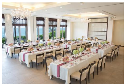
〈1階「THE GARDEN」 収容人数: 60名(着席)〉

チャペルから独立したプライベートコテージを新設。親族控室に加え、ゲスト待合室も備えており、他のカップルゲストに会うことなくお待ちいただけます。海をイメージしたパールブルーのウォールとアメリカンカジュアルなインテリアが心地いい空間で、カウンターバーでは沖縄のハイビスカスでつくられた「Beni」のウェルカムドリンクでゲストをおもてなし。