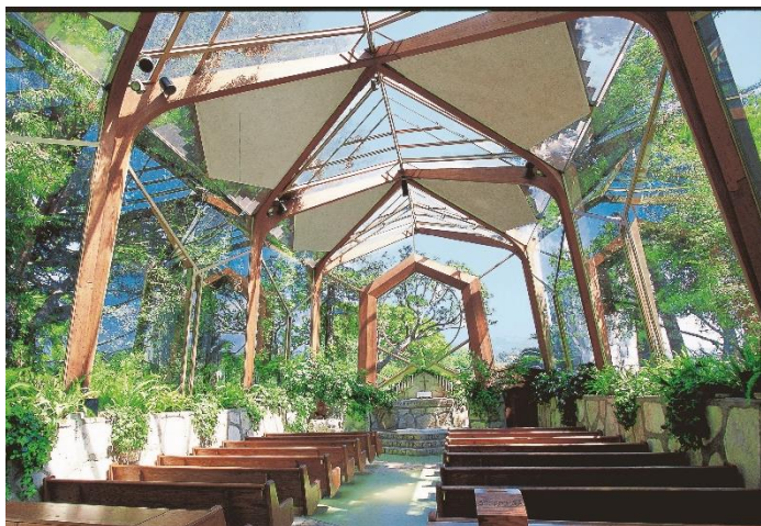
<ウェイフェア・チャペル>