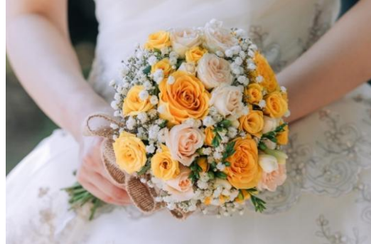
イエローローズとかすみ草のミニクラッチ