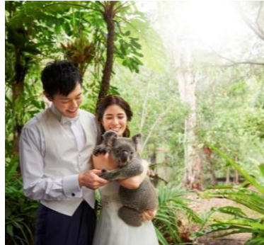
【世界遺産 キュランダ】 コアラフォトツアー ¥148,000 (追加枚数：約10枚)