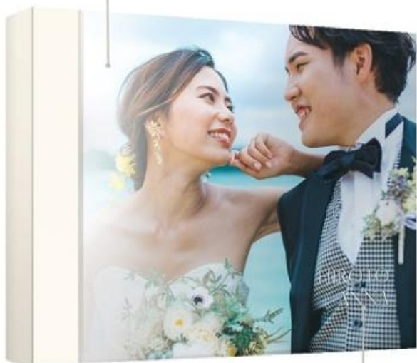
新郎新婦名前が入ります (プリント)