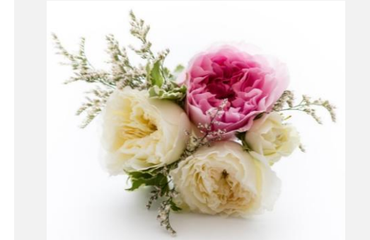
シャビー・エレガンスの ミニクラッチブーケと お揃いのヘッドピース