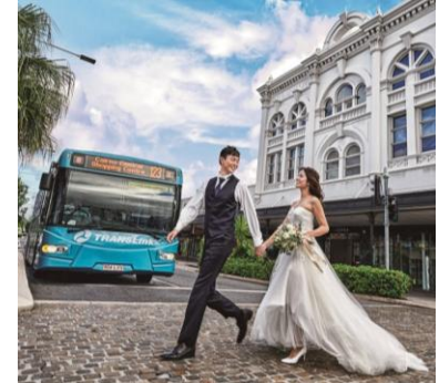
ケアンズ街中フォトツアー ¥98,000 (追加枚数：約30枚)