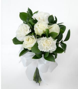
ホワイトを基調とした 季節の花のクラッチ