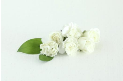
ホワイトを基調とした 季節の花のクラッチブーケと お揃いのヘッドピース