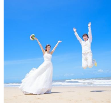
ビーチフォトツアー ¥98,000 (追加枚数：約30枚)