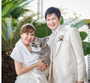
【ケアンズ市内】 コアラフォトツアー ¥108,000 (追加枚数：約10枚)