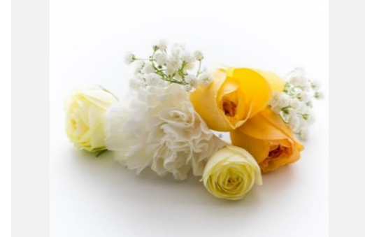
イエローローズと かすみ草のミニクラッチブーケと お揃いのヘッドピース