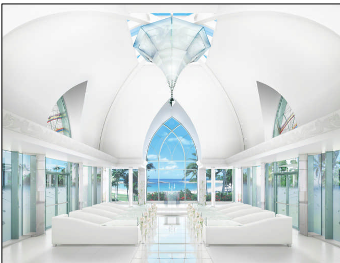
【「コオリナ・チャペル・プレイス・オブ・ジョイ」改装後のイメージ：ガラスのシャンデリアやガラスのバージンロード、ソファなどを新設。】

（※3）リゾートウェディングの意。「挙式」と「旅行」をセットにした、居住地以外の地域で挙式を行うウェディングスタイル。