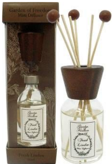
「アロマディフューザー」