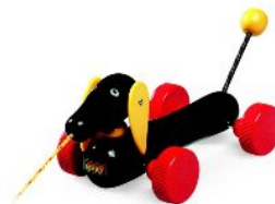
「BRIO社 プッシュ&プル玩具「ダッチー」」 先着20組