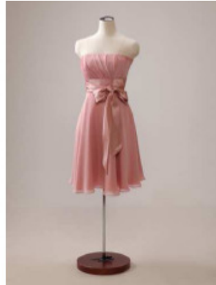
③サテンリボンミニ丈

ウエスト部分にサテンリボンをあしらった、メリハリのあるデザイン。リボンは後ろで結ぶことも可能。