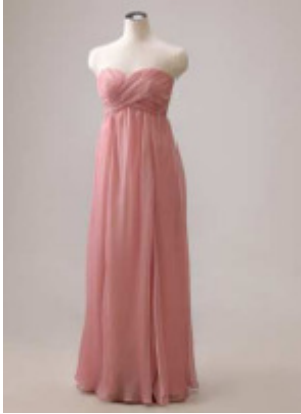
①ハートネックロング丈

シャンブレー効果のあるシフォンジョーゼットを使用した上品な仕上がりのフルレングスドレス。細かくよせたドレープのハートネックが女性らしい一着。