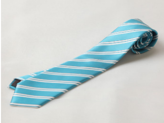
①タイ&チーフ(ブルーグリーンxホワイト) ②タイ&チーフ(ネイビーxピンク) ③タイ&チーフ(ピンク・ドット) ④タイ&チーフ(ライトブルー・ドット)