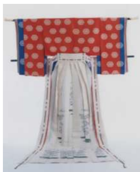
新宿ドレスサロン&フォトスタジオ