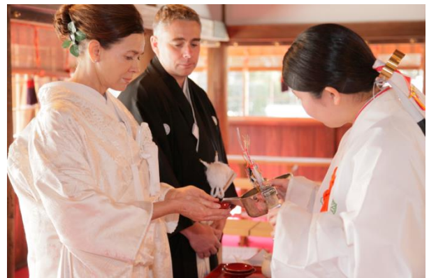
<日本で挙式した場所第 3 位「神社仏閣」>

また、日本で行われた結婚式への参加経験については「ある」と答えた方が 53.6%にのぼり、約半数は参加経験があることが分かりました。