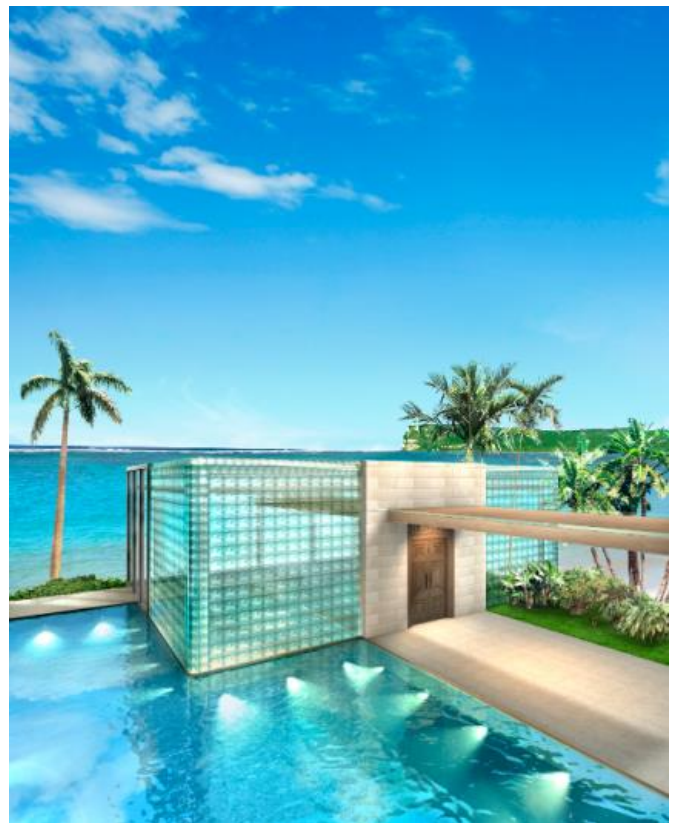
(完成予想イメージ)

今回はオープンを記念して、2015年12月31日までに挙式をするカップルには、ゲスト送迎（最大10名様用／車種の指定なし）をプレゼントいたします。