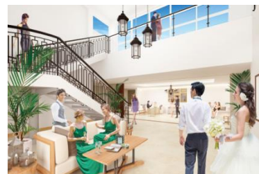
(完成予想イメージ)