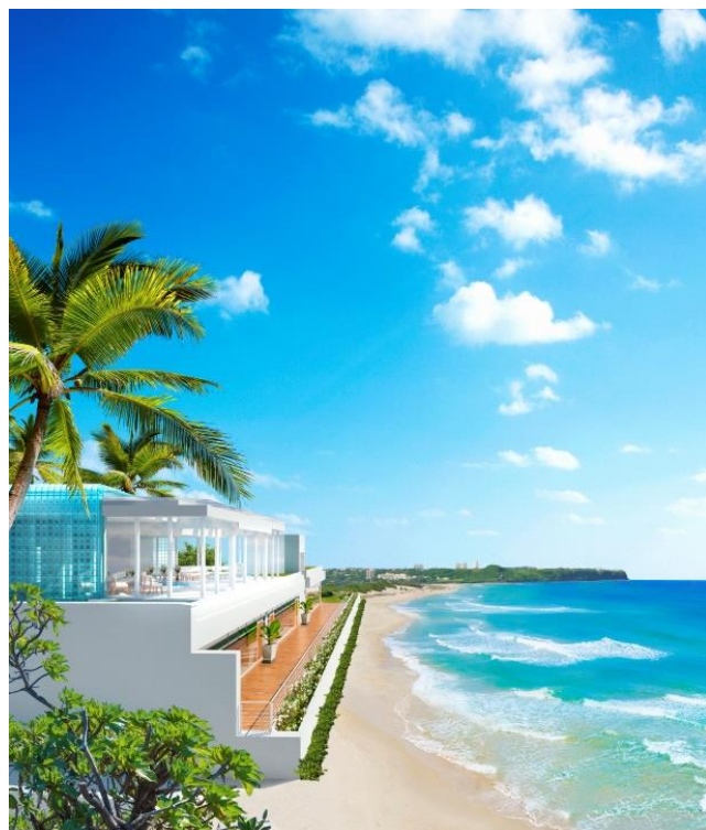
(チャペル外観 完成予想イメージ)

今年グアム島進出 20 周年を迎えた当社では、リゾートウェディングのリーディングカンパニーとして、今後も様々なウェディングを提供してまいります。