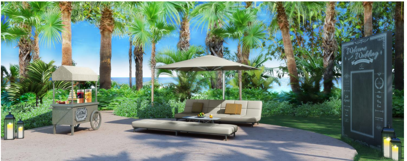
(完成予定イメージ)

南国の木々に囲まれたオーシャンビューのリビングガーデン。フォトウォールやデザートワゴンなど、ゲストと一緒に楽しめるフォトスポットが満載。