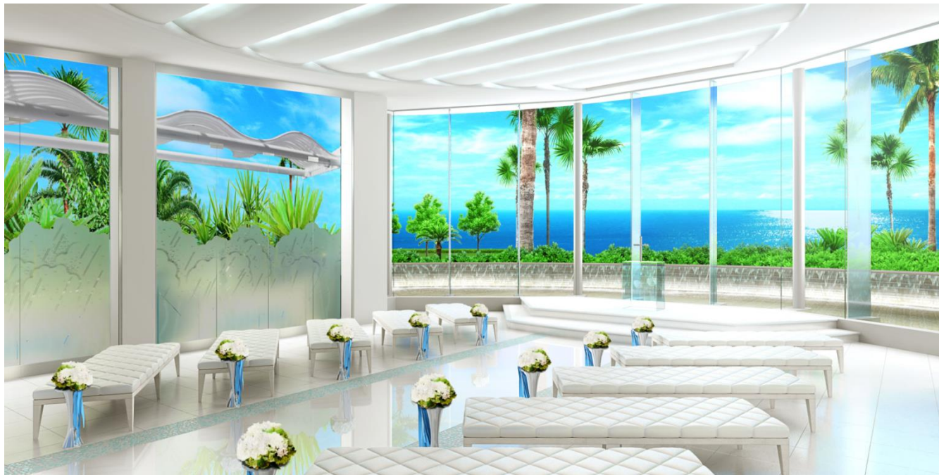
(完成予定イメージ)

ワタベウェディング株式会社【本社：京都府京都市、資本金 41 億 7,637 万 2,000 円、東証第一部上場、代表取締役 花房伸晃】は、ハワイ・オアフ島コオリナ地区に建つ「アクアベール フレ・マリーナ・コオリナ・ブル・プラージュ」をリニューアルし、2017年2月1日(水)、コオリナリゾートの魅力をより体感できるチャペル『コオリナ・チャペル アクア・マリーナ』としてオープンいたします。