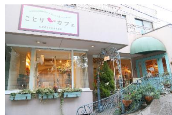
「ことりカフェ表参道」