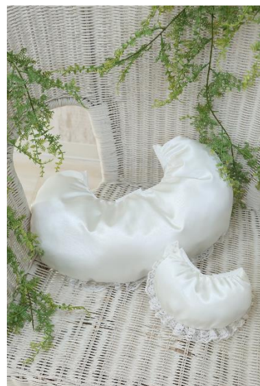
上：プリンセスラインドレス用 下：Aラインドレス用

今後も当社は、おふたりにとって特別な 1 日を演出すべく、花嫁の美しさと魅力を引き出すウェディングドレスの着こなしを提案してまいります。