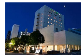
ホテル メルパーク岡山