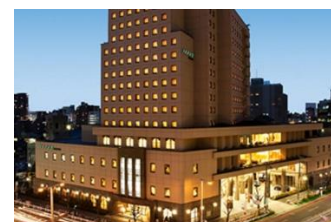
ホテル メルパーク名古屋