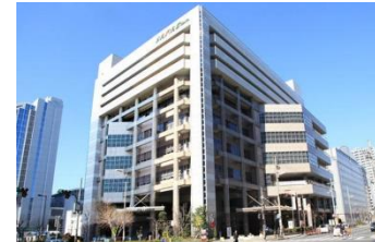
ホテル メルパーク大阪