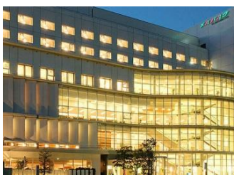
ホテル メルパーク熊本