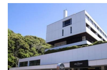
ホテル メルパーク松山