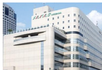
ホテル メルパーク広島