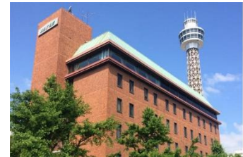
ホテル メルパーク横浜