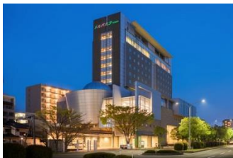
ホテル メルパーク仙台