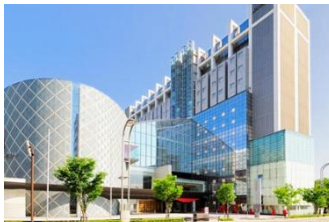
ホテル メルパーク長野