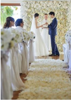
ハウテラス・ウェディング・アット・ハレクラニ