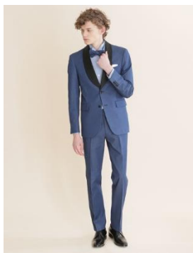
BEAMS-3 FORMAL DENIM