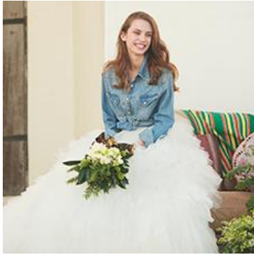
BEAMS DRESS / BEAMS MARINE アレンジスタイル