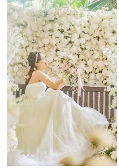
ジ・アカラ チャペル