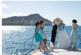
クルージングフォトツアー