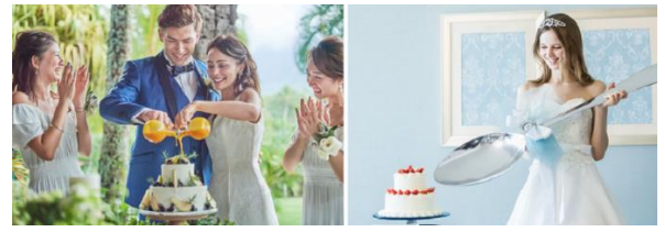
(左) カラードリップケーキ / (右) ビッグスプーン