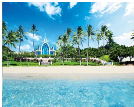
コオリナ・チャペル・プレイス・オブ・ジョイ