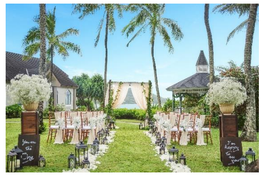
ザ・プライベート・ガーデン アロハ・ケ・アクア カハルウ・クローブ