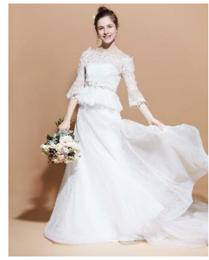
BEAMS DESIGN PRINCESS