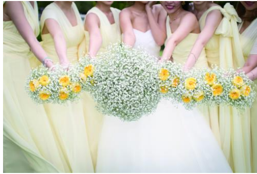
かすみ草ブーケ、ブライズメイド用かすみ草ブーケ