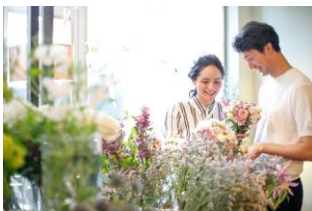
現地フローリストと作る オリジナルフラワーアイテム

一方で、2017年5月よりスタートした、人気エリアのリゾ婚が8万円以下で申込み可能なオンライン限定のブランド「EASY by WATABE WEDDING」( https://www.watabe-wedding.co.jp/easy/ )は、低価格・オンラインという手軽さが支持を集め、結婚当時に式を挙げなかった「なし婚」と言われる方々などから注目を集めています。