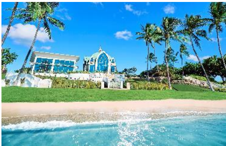
コオリナ・チャペル・プレイス・オブ・ジョイ