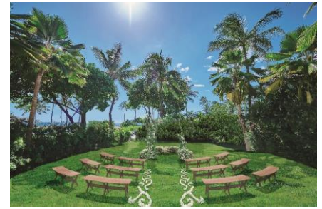
コオリナ アクア・マリーナ ガーデンウェディング