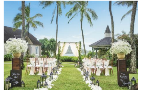
ザ・プライベート・ガーデン アロハ・ケ・アクア カハルウ・グローブ