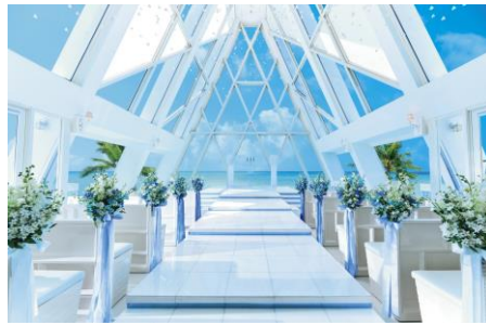
ブルーアステール