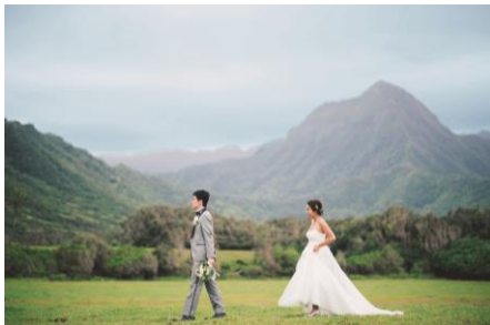
クアロア・カアアヴァ フォトツアー

さらに、ハワイや沖縄などのリゾート地では挙式会場のあるエリアごとに入手可能な花材が異なるため、国内の専門式場などに比べると、フラワーコーディネートが限られていましたが、国内外の様々な花材を使ってオーダーメイドができる「MY FAVORITE FLOWERS」の販売を開始し、リゾート婚でもおふたりのこだわりが叶うウェディングフラワーを提供することが可能となりました。