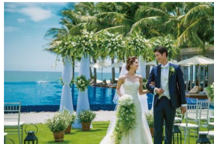
ナマンリトリート ガーデンウェディング