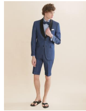
BEAMS-3 FORMAL DENIM