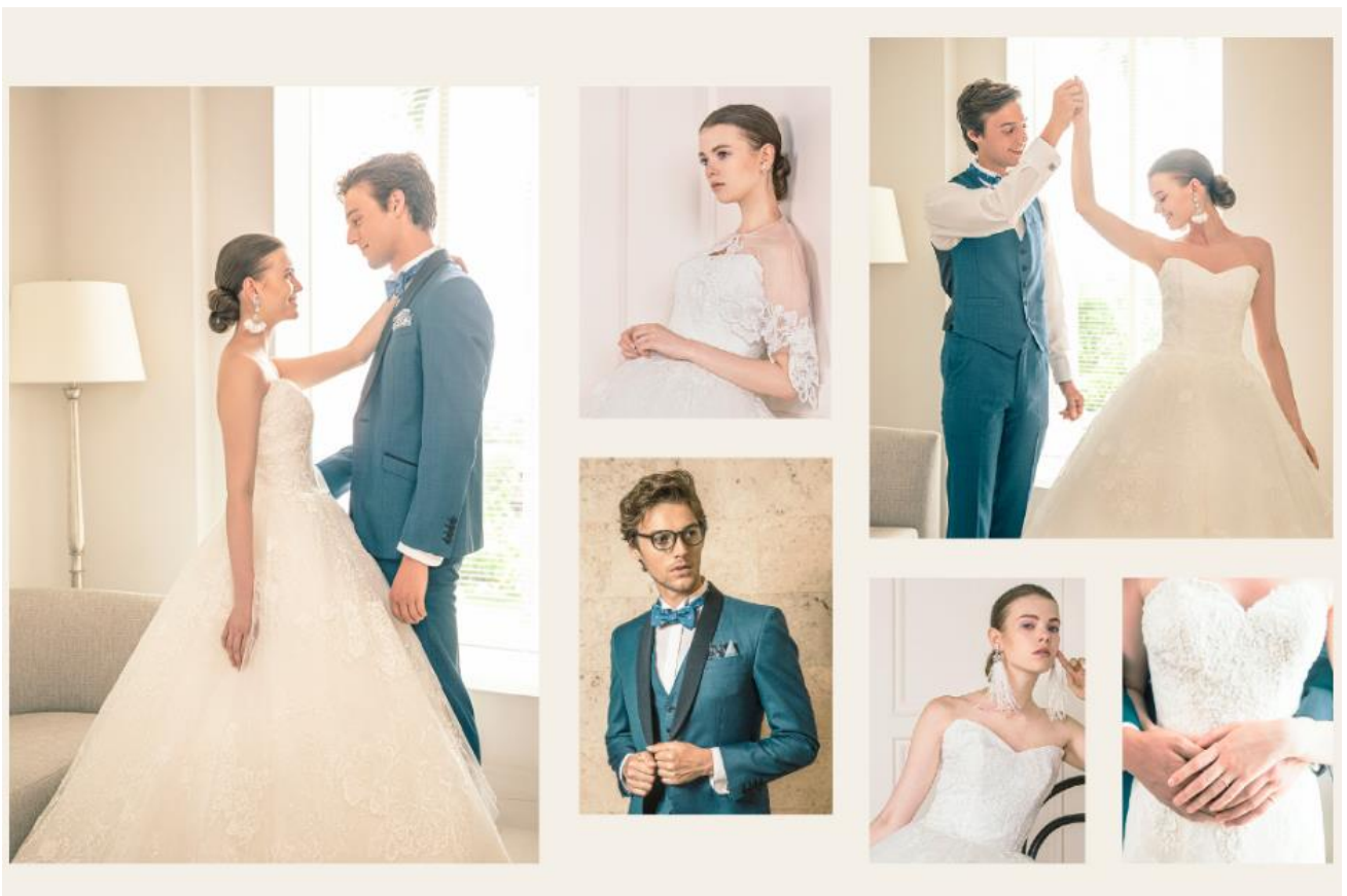
<格式を感じる優雅な雰囲気映える衣裳のイメージ>