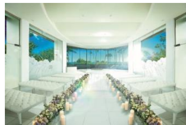
<チャペルウェディング 挙式イメージ>

「コオリナ アクア・マリーナ」は、かつてハワイ王朝に愛された高級リゾート地であるコオリナ地区に建つ婚礼施設で、2020年2月1日（土）にリニューアルします。目の前に広がる美しい海と空を眺めながら、降り注ぐ光がキラキラと輝く360度ガラス張りの空間でのチャペルウェディングと、ハワイのそよ風と光を感じながら、シンプルでナチュラルな挙式が叶う“ガーデンウェディング”、2つウェディングスタイルをご提案します。