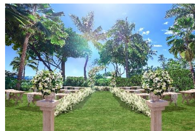
<ガーデンウェディング 挙式イメージ>