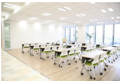
<セミナースペース>