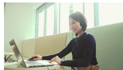
<接客スタッフイメージ>