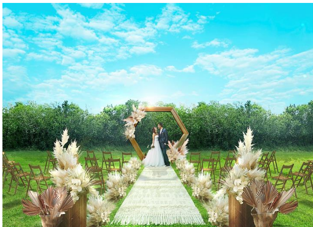
新挙式会場「クルデスール・ガーデン The Breeze～風の祝福～」イメージ